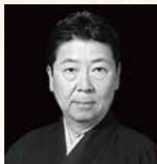
シテ 粟谷 明生 能楽シテ方喜多流 重要無形文化財保持者総合認定