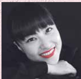
ヤマザキーナ 俳優(4期生)